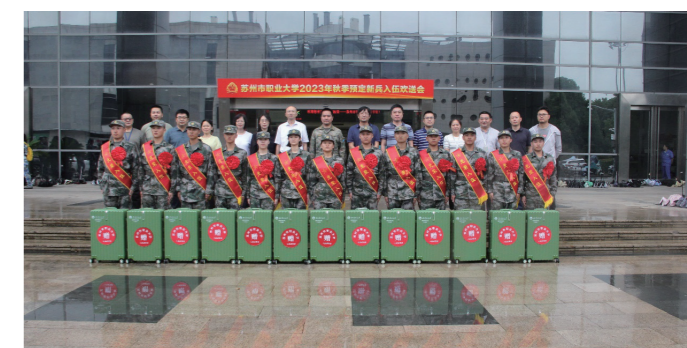
通讯员: 刘刚; 文字: 刘刚; 摄影: 刘刚